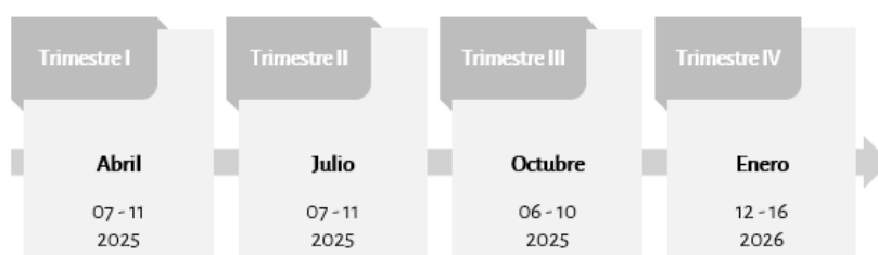
Esquema 2. Monitoreo trimestral a las Ae del PAEG 2025

El monitoreo del PAEG se realizará conforme al calendario establecido (ver Esquema 2). Para dar atención a ello, las UE de los SNI y las UA del INEGI-UCC reportarán el avance realizado en la ejecución de sus Ae en el sitio de monitoreo del PAEG.