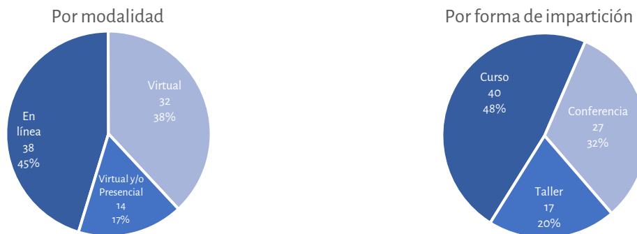
Gráficos 2 y 3. Clasificación de temas por modalidad y forma de impartición